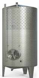
Doppelmantel Typ V1