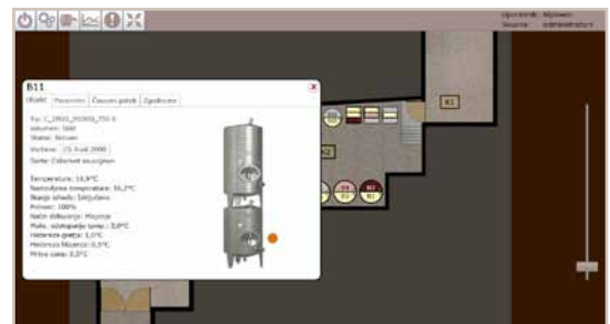
Dialogbox mit Grunddaten von einem Objekt